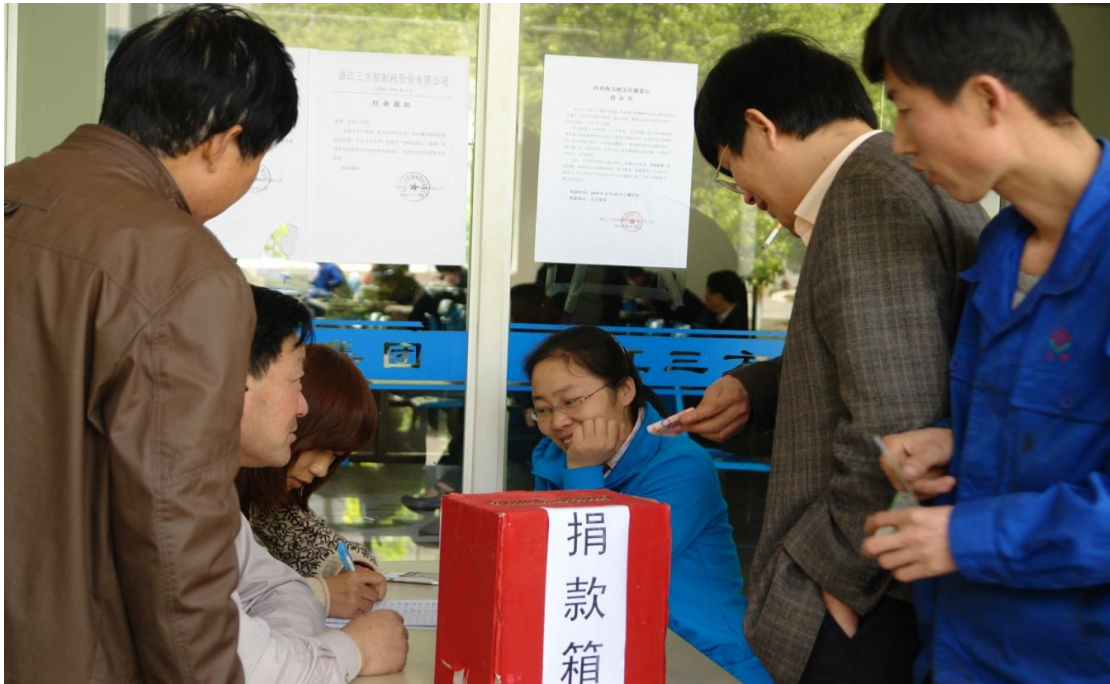
图6 员工为玉树地震捐款

如在生产员工座谈会中，有员工反映因为生产的季节性差异和操作工的工艺差异，导致员工的薪资水平下降，工人流失严重，而一忙起来技术工人难招，影响生产进度。总经理了解后当场提出了改变生产方式，改善生产环境，以保证员工的收入水平与工作稳定性，明显提高了员工队伍的稳定性。