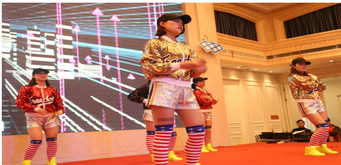
图3 公司35周年庆典员工文体活动

公司十分重视员工的文化建设和健康。这主要体现在公司努力为员工创造舒适的工作环境和生活环境,如宽敞明亮的办公室和车间;干净整洁配备空调的员工;提供篮球场、乒乓球桌等休闲娱乐场所等等。除了硬件保障之外,公司还通过诸如劳动技能竞赛、员工聚餐和文娱活动等员工活动来调动员工的工作激情,丰富员工的业余生活,获得了员工的广泛好评,如下图: