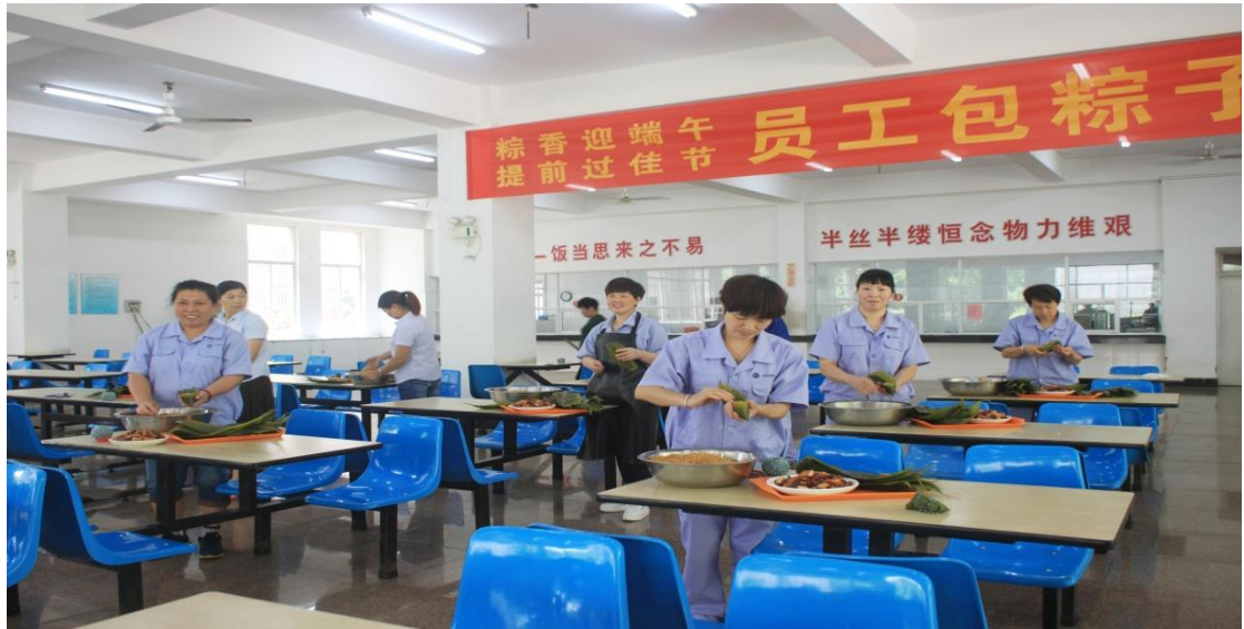
图4 端午节员工包粽子比赛

公司一贯坚持诚信共赢的经营理念，积极维护相关方利益。公司通过规范化运行、精细化管理，以良好的企业经济效益回报员工和社会；定期召开股东会，对公司重大决策进行监督，定期审计重大项目，实现资产保值增值，保护股东权益。