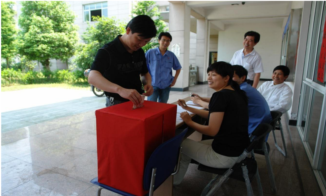
图5 员工为汶川地震捐款

公司通过各种方式，如国庆、元旦联欢、技能竞赛、文体活动等，丰富员工的工作和业余文化生活，构造和谐工作环境，还组织了汶川、雅安地震捐款，激发员工爱心、积极性和创造性，促进公司和谐发展。公司还建起了篮球场、阅览室、员工活动室等娱乐设施，满足员工多层次需求，让员工真正感受到三方大家庭带来的快乐和温馨。