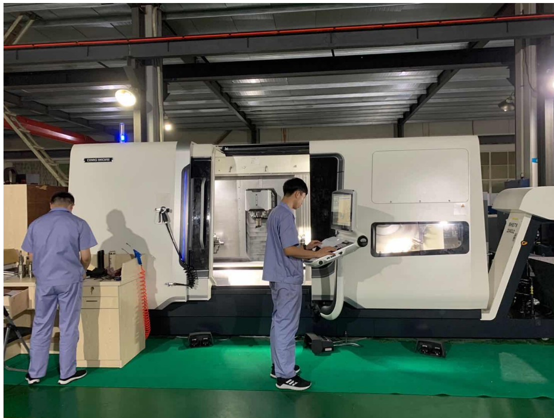
图1 加工中心工作现场

公司认真贯彻执行《劳动法》、《安全生产法》、《职业病防治法》，制定《安全生产责任制》、《安全目标管理制度》、《劳动防护用品管理制度》，对特殊工种采取特殊防护，配置必须的劳保用品。成立了安全生产领导小组，通过安全知识培训、开展安全比赛，强化全员安全意识，降低事故发生率。针对生产过程中遇到的各类安全状况，各制定了详细的管理规定、操作规程及预案定期对车间进行6S安全检查，并及时记录安全隐患。